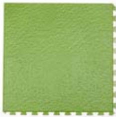
Olive Vine Tuscany