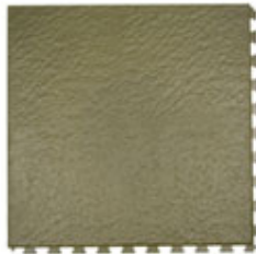
Tuscan Green Tuscany