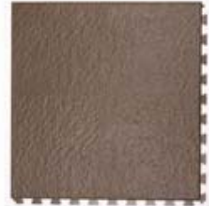
Antique Brown Slate